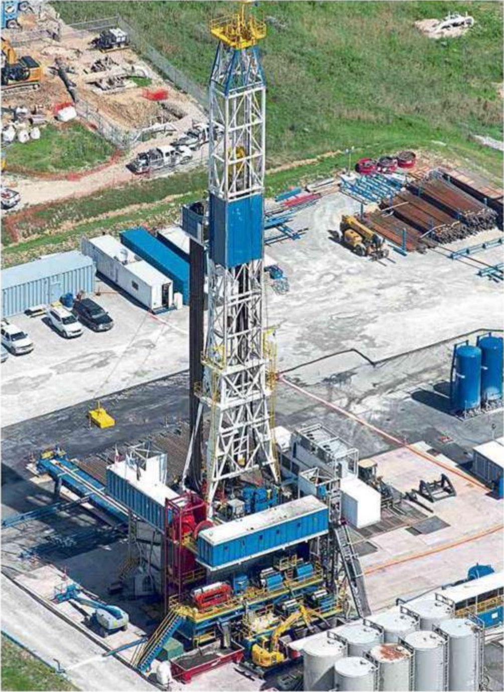
Se debe evitar la manipulación y especulación sobre la información del 'fracking' en Colombia, así como desarrollar proyectos piloto para analizar su viabilidad económica, social y medioambiental.

El parapsicólogo Alexánder Torres asegura haber tenido experiencias paranormales cercanas. Conozca lo que encontró en siete lugares terroríficos de Colombia.