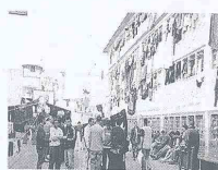
RECLUSOS piden construir más cárceles.

El Jefe de Estado anunció que en coordinación del Ministerio de Justicia se declarará la emergencia carcelaria en el país. Dijo que la decisión será tomada por el Inpec con el visto bueno del Ministerio de Justicia, para definir el día y la hora de decretar dicha emergencia. "Esto con el fin de poder acelerar la ejecución de una serie de recursos que se le van a dar al Inpec para poder aumentar su capacidad carcelaria", explicó el presidente Santos. La emergencia carcelaria se decretará con el fin de aten-