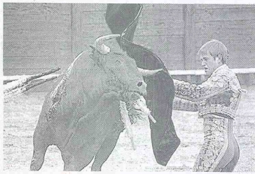
MÁS DE 80 organizaciones anti taurinas de diferentes partes del mundo se reúnen en Bogotá para apoyar al alcalde Gustavo Petro por sus decisiones en contra de las corridas de toros.