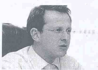
EX ministro Andrés Felipe Arias.