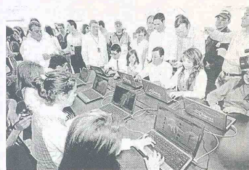
CON una inversión superior a los 514 millones, el Ministerio TIC entregó en Sincelajo un punto Vive Digital, espacio que traerá beneficios para la comunidad logrando conectarse a internet.