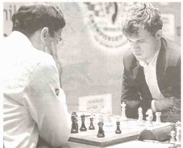
Carlsen recibe, junto a la corona, un premio de 600.000 euros y Anand se embolsa, como consuelo, 400.000.

Un marcador de 6,5 a 3,5 puntos, clausuró el encuentro de Madrás (India), previsto a doce partidas, aunque la superioridad del aspirante, que a diferencia de su adversario no cometió errores de bulto, hizo innecesaria la disputa de los dos últimos juegos. El joven noruego, que en enero pasado batió el récord de puntuación ELO -hasta entonces en poder del ruso Gari Kaspa-