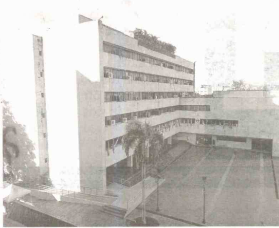
La orden judicial ordena congelar 8000 millones de pesos del presupuesto de la Gobernación del Huila que se adeudan al Hospital Universitario de Neiva.

Se conoció que el HUN también demandó y logró el embargo de las cuentas de la Caja de Compensación Familiar del Huila, Comfamiliar Huila. El monto no fue revelado.