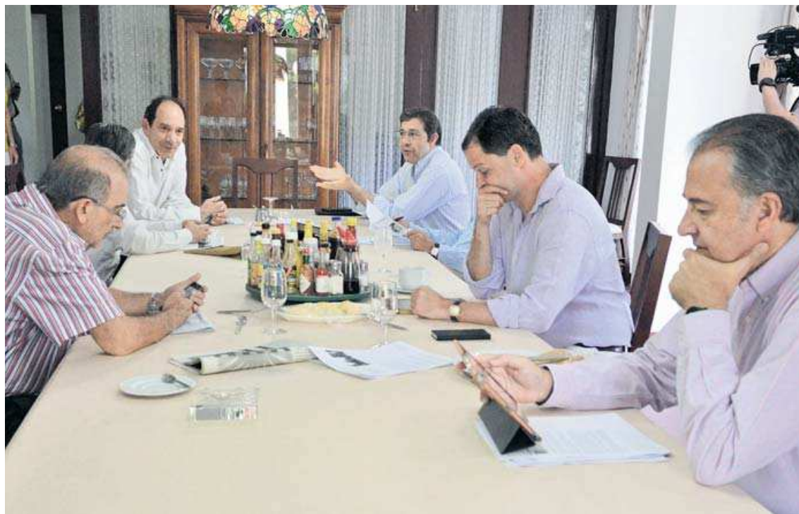
A Cuba llegaron ayer los asesores del Gobierno para discutir el tema del Marco Jurídico para la Paz.

La llegada a la mesa de negociaciones en Cuba de los dos asesores jurídicos y del exper-