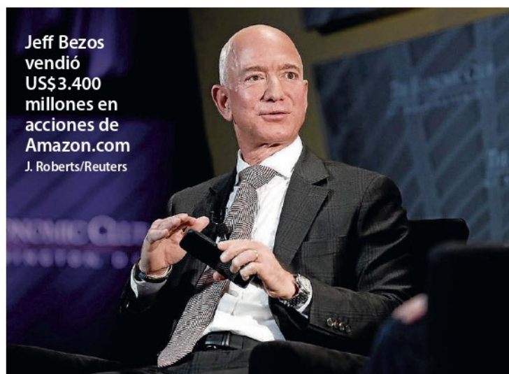
Jeff Bezos vendió US$3.400 millones en acciones de Amazon.com