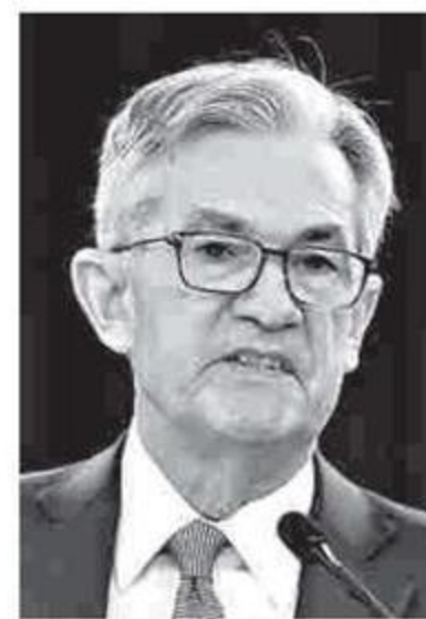
Jerome Powell es el presidente de la Reserva Federal.

Y afirmó que la Fed está decidida a desplegar todas