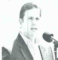
Juan Carlos Pinzón, Ministro de Defensa

La conformación en la década de los 90 de grupos paramilitares que operaron en Antioquia y de los crímenes imputados a estas organizaciones; recaudar datos sobre la Convivir El Condor y sus creadores; constatar si el jefe de las autodefensas alias Filo, quien al parecer habría tenido su base de operaciones en la finca Guacharacas, falleció en el año 2000, y verificar si Santiago Uribe tiene anotaciones penales o trámites de extinción de dominio, fueron algunas de las pruebas ordenadas por la justicia en el expediente que se adelanta contra el expresidente Álvaro Uribe por sus presuntos nexos con el paramilitarismo. El fiscal delegado ante la Corte Roberto Arturo Puentes ordenó 21 pruebas que deberán ser recaudadas por el CTI de la Fiscalía para establecer si Álvaro Uribe patrocinó, en su calidad de gobernador de Antioquia, los ejércitos privados de los "paras".