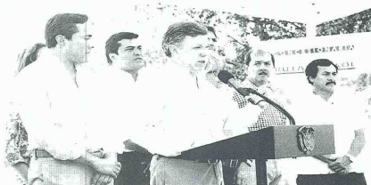
Presidente Juan Manuel Santos hace anuncio público desde La Liza, Santander

En cuanto a los diálogos de paz, la Delegación del Gobierno Nacional, en cabeza de Humberto de la Calle, les entregó al Jefe de Estado y a su Gabinete un detallado informe sobre los avances en la materia. Así mismo, el Presidente Santos confirmó que los miembros de la Delegación del Gobierno para los diálogos de paz viajarán nuevamente a Cuba mañana para continuar desarrollando el primer tema de la agenda referente al desarrollo rural. "En el Consejo de Ministros se trataron los siguientes puntos: el primer punto fue una información que dio Humberto de la Calle y los negociadores sobre cómo va el proceso de paz. El Gabinete estaba interesado, el equipo negociador y el Presidente estamos interesados en informar al Gabinete sobre la evolución del proceso de paz",