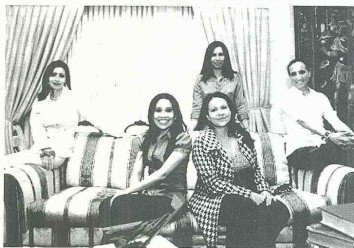
Grupo de profesoras que dictará por seis meses el curso de Español. Las docentes pertenecen al Centro de Español para Extranjeros CEPEX de la Universidad Externado de Colombia