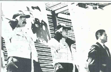
Mindefensa entregará parques automotores y uniformados en tres departamentos de la Costa Caribe. Revisión de seguridad con autoridades locales complementará agenda de la gira que adelantará el Ministerio de defensa en el fin de semana.