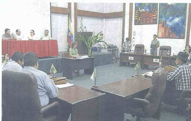
Si las comisiones del plan y presupuesto avalan los dos proyectos, pasarán a la plenaria de la Asamblea.

por 281.000 millones de pesos, que corresponden a recursos del balance del año anterior y que se incorporan a la actual vigencia, se distribuirán 3.724 millones para funcionamiento y 177.000 millones para inversión e infraestructura.