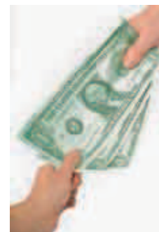
El Banco de la República ve con buenos ojos este aumento.

La meta en esta materia puesta por el Ministerio de Comercio, Industria y Turismo, liderada por Sergio Díaz-Granados, es alcanzar los US$15.000 millones por balanza de pagos. PUBLIMETRO