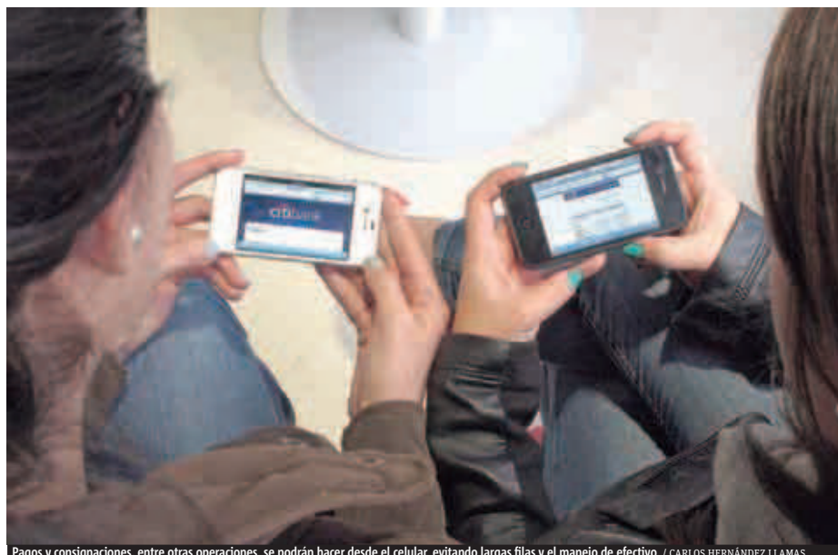
Pagos y consignaciones, entre otras operaciones, se podrán hacer desde el celular, evitando largas filas y el manejo de efectivo.

Para analizar los casos de publicidad engañosa y el efecto dañino que puede tener en el consumidor, se realizará el foro 'La protección al consumidor colombiano frente a la publicidad engañosa'. Será desde las 7:30 a.m. en la sede de la universidad. PUBLIMETRO