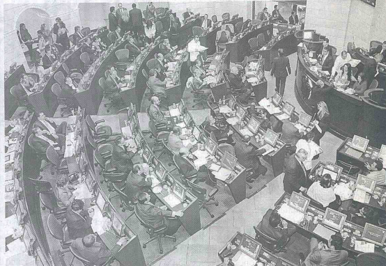
Todo lo que se ha tratado hasta el momento en el Congreso de la República, relacionado con el equilibrio de poderes, será socializado en la mañana de hoy en la ciudad de Pasto, en un importante evento en la Cámara de Comercio.

El programa del panel comienza a las 9:00 de la mañana con el registro de asistentes y a las 9:30 comenzará el acto de manera oficial