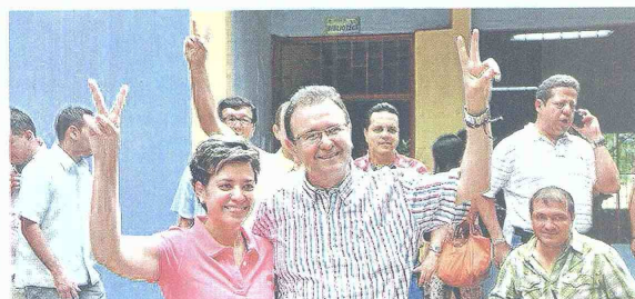
EL NUEVO MANDATARIO seccional obtuvo 105.408 votos, con el 90.04% de las mesas escrutadas.