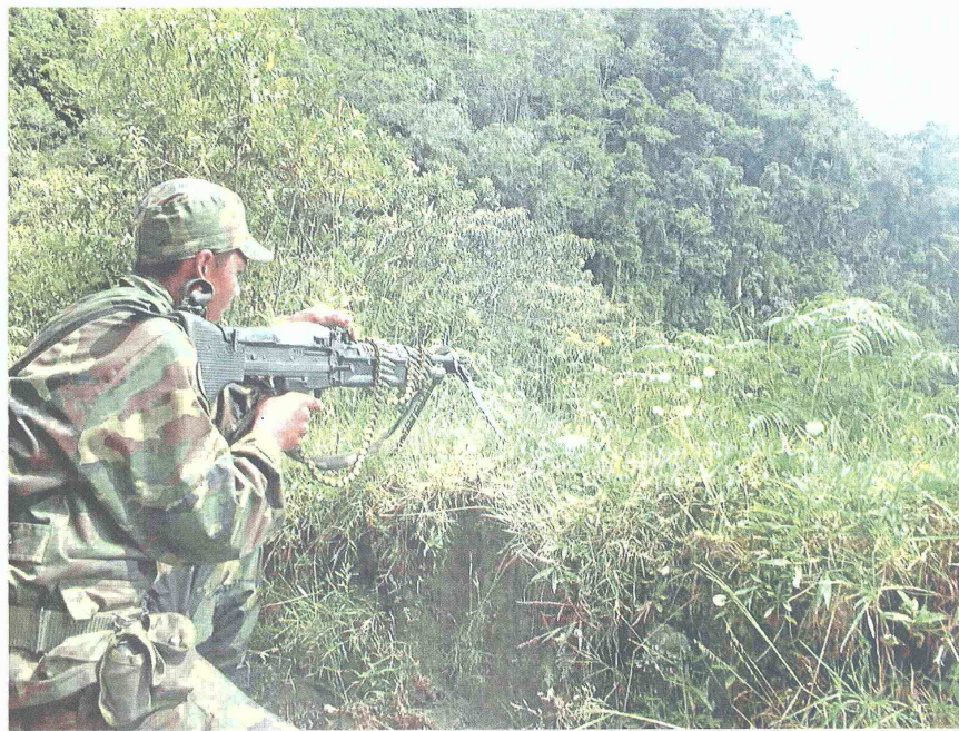
SEGÚN LAS PRIMERAS INFORMACIONES, dos presuntos guerrilleros dispararon contra los militares desde una motocicleta, mientras estos se encontraban realizando trabajos de registro y de control en el lugar.

BOGOTÁ, COLPRENSA. La Sala Disciplinaria del Consejo Superior de la Judicatura informó que, durante el primer trimestre de este año, han sido sancionados ocho funcionarios judiciales y 42 abogados por haber incurrido en faltas que atentan contra las disposiciones disciplinarias.