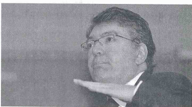
El ministro de Hacienda, Mauricio Cárdenas, le preocupa que el paro en el Correjón desvíe las expectativas.