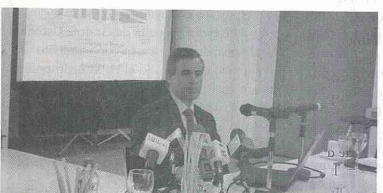
Orlando Cabrales Segovia, será uno de los hombres más poderosos del sector minero.

El nuevo presidente de la ANH llega de ser viceministro de Hacienda, además de haber pasado por cargos como director general de crédito público y tesoro nacional. Arce Zapata se graduó en la Universidad del Valle, tiene un Máster en International Securities, Investment and Banking del Isma Centre de la Universidad de Reading en el Reino Unido.