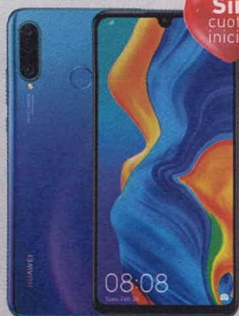
Huawei P30 lite

Precio Cliente Claro $1.199.900 Precio normal: $ 1.459.900