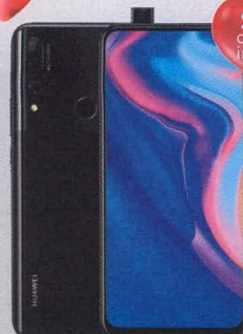
Huawei Y9 Prime 2019

Llévalo en 12 cuotas mensuales de: $111.304 Precio Contado: $ 1.140.900