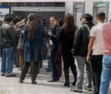
COLOMBIA, SEGÚN LAS ESTADÍSTICAS, tiene una tasa de desocupación más alta que la de Chile, Ecuador, Perú, Ecuador y Argentina.

El mismo panorama vivieron la mayoría de países de la región en septiembre; Chile (7,1%), Argentina (7,20%) y Ecuador (4,28%) registraron