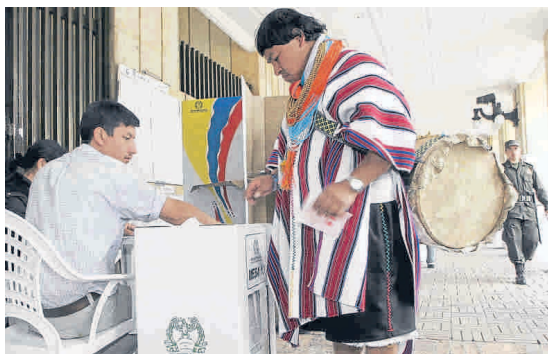
Los partidos indígenas consideran que en Cauca tienen opciones de ganar varias alcaldías.

Mientras tanto, Nebio Echeverri, controvertido