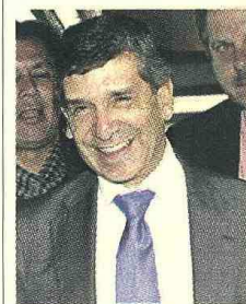
Ministro Rafael Pardo. Archivo

A la reunión asistirán ministros de trabajo y líderes empresariales y sindicales de la región.