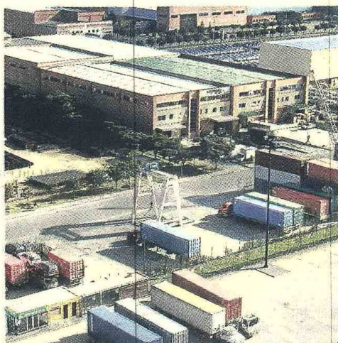
La zona franca de Bogotá es una de las de mayor dinámica comercial en el país.

El crecimiento en el ingreso de mercancías a las zonas francas, en dinero, ascendió a 12.431 millo-