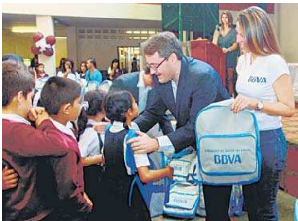
Entrega de kits escolares en un colegio de Envigado, por parte del banco Bbva, el año pasado.