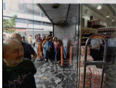
EL GOBIERNO VENEZOLANO las largas filas serían producidas por la falta personal en las cajas registradas y no por la escasez de productos.

Nueva York (AFP) La petrolera estadounidense Exxon Móvil registró una caída del 21,3% en sus beneficios netos durante el último trimestre de 2014. Las ganancias de la empresa fueron de 6.570 millones de dólares.