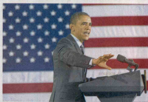
EL PRESIDENTE DE ESTADOS UNIDOS, BARACK OBAMA destacó el aumento de los impuestos a las familias más ricas del país.

Asimismo, Obama buscará revertir los recortes presupuestarios automáticos, que comenzaron a aplicarse en 2013, aumentando los gastos en 74.000 millones de dólares -la mitad irá al gasto militar- en relación al límite autorizado.