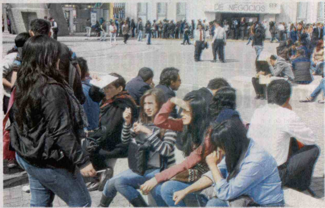
SEIS DE CADA DIEZ JÓVENES CON EMPLEO están contratados de manera informal.

Medina agrega que "en las zonas laborales se encuentran estudiantes con más experiencia y los desplazan, entrando a la escena la popular frase de "no