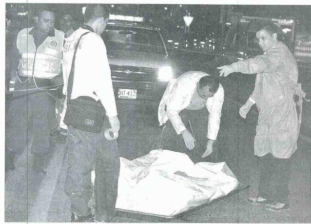
LA ORGANIZACIÓN criminal de 150 hombres, según fuentes de inteligencia, habría sido absorbida por 'los Urabeños', quienes llegaron al Puerto desde mediados del año pasado para apoderarse de todos los negocios ilegales.

Aquella deslealtad explotó el 6 de octubre, cuando alias 'Ramiro', uno de los cabecillas de 'la Empresa', fue asesinado en la puerta de su casa del barrio La Independencia. Desde entonces, en el municipio se desató una guerra que solo ese mes dejó más de 60 muertos. Luego de 'Ramiro' siguieron