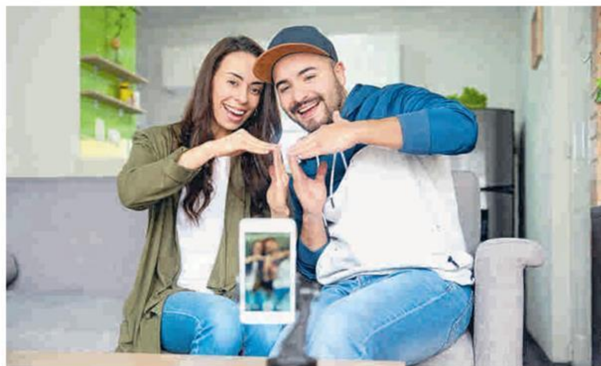
La red social TikTok tendrá unas semanas más de respiro para operar en EE. UU.