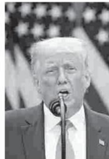
Trump tendrá hoy el primer debate con Biden.

El mandatario reaccionó a la publicación en una