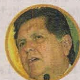
ALAN GARCÍA 1985-1990 y 2006-2011

Acusado por el expresidente de Odebrecht de haber recibido dinero y destituido