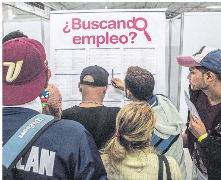
El 43,6 % de las empresas se dedican a servicios, indica la Alcaldía de Bogotá.

La entidad afirma que para este año hubo una inversión de $2.486 millones en la potencialización del trabajo y en el incremento del empleo en la ciudad.