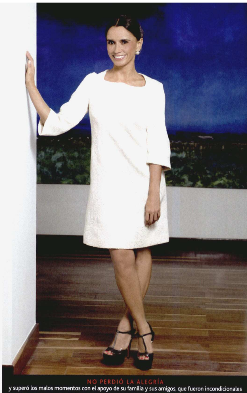
NO PERDIÓ LA ALEGRÍA y superó los malos momentos con el apoyo de su familia y sus amigos, que fueron incondicionales

a Toronto para entender qué hace la planta y cuáles son los indicadores para la producción. Entendí que debía adaptar mi experiencia a un negocio donde las variables son otras".