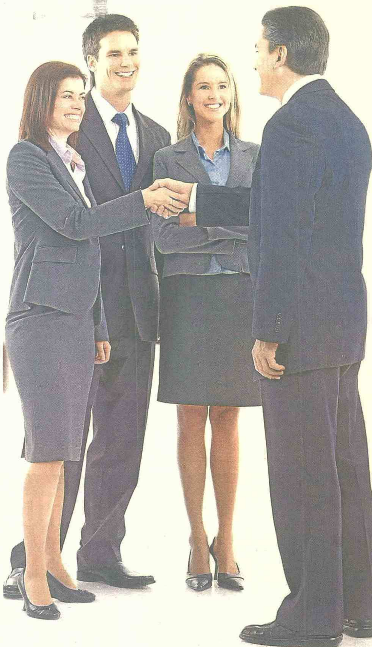
Academia, empresariado y gobierno se preparan frente a las nuevas condiciones de los negocios.