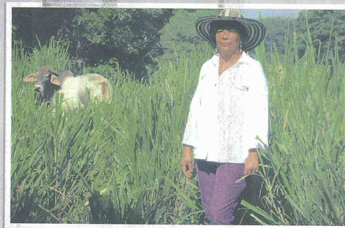
IN QUEBANCIO AGROARIO DE COLOMBIA

Título obra: el arte de realizar sus proyectos