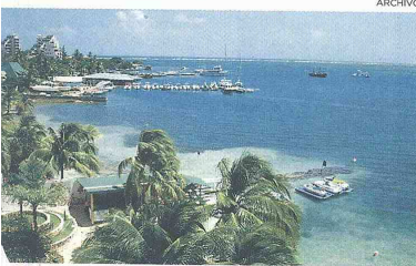
San Andrés necesita más atención del Gobierno Nacional.