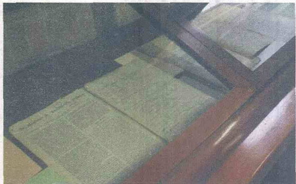
Al archivo llegan todos los documentos de la rama ejecutiva del nivel central.

AGN, para consulta de los colombianos en el ejercicio del deber de transparencia.