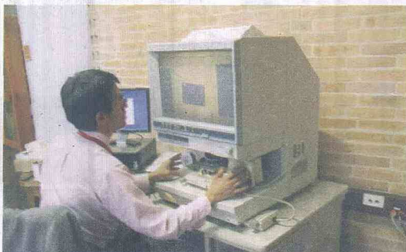
"La memoria histórica la estamos construyendo en el día a día. Hoy Colombia es el primer y único país del mundo, en donde en medio del conflicto estamos preservando la memoria del conflicto", sostuvo Zapata.

grafía más antigua que tiene Colombia. Tenemos todas las Constituciones Políticas originales, las cuales han sido traducidas a lenguas indígenas.