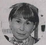
Alicia Arango Ministra de Trabajo

"También hay que ver la relación que puede haber entre el indicador de informalidad y el de desempleo, porque puede ser que hay personas que pasan a ser inactivas".