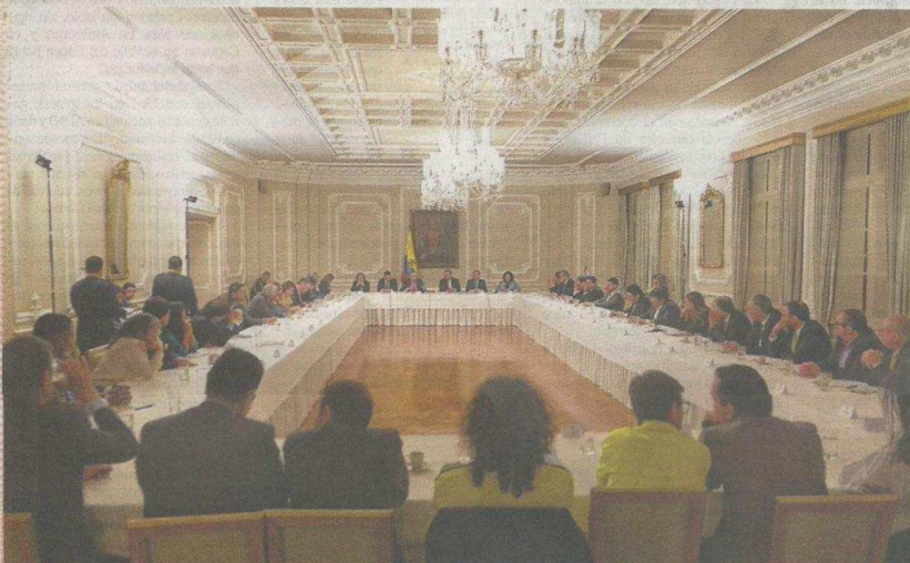
El pasado miércoles, las distintas fuerzas políticas con representación en el Congreso de la República se reunieron por espacio de cuatro horas en la Casa de Nariño para convenir un respaldo mayoritario al mandato anticorrupción expresado por los colombianos el domingo pasado en las urnas.

En febrero del 2017 se inició la recolección de firmas para la Consulta que obtuvo más de 11,6 millones de votos.