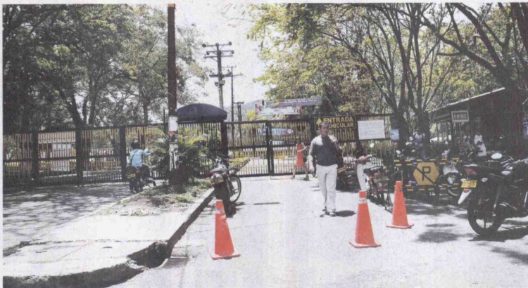
La Universidad del Tolima abre una oportunidad de acceso a la formación avanzada de profesionales, a menor costo y en el lugar de trabajo de la mayoría de ellos.

Se espera que la demanda de cupos para cursar esta maestría sea suficien-