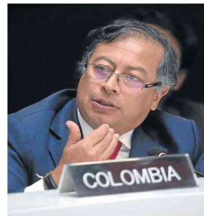
Presidencia de la República

El jefe de Estado, Gustavo Petro , intervino en la reunión de presidentes andinos.