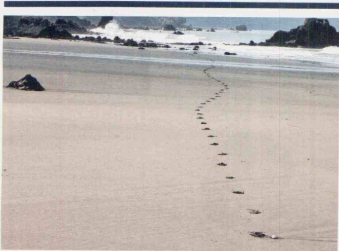
Playas de Punta Brava en Chocó.