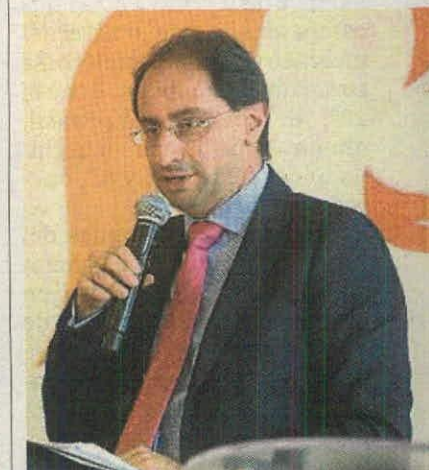
Ministerio de Comercio