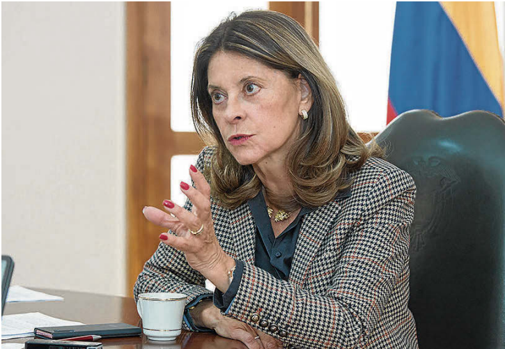
Vicepresidencia de la República