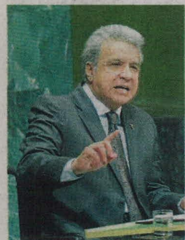
Lenín Moreno , mandatario ecuatoriano, asistirá a la cumbre en calidad de observador.