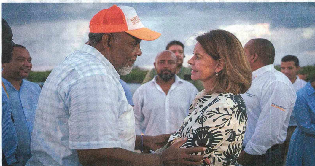
La vicepresidenta y canciller, Marta Lucía Ramírez, se reunió con habitantes del archipiélago, desde donde ella y el presidente Duque, así como otros miembros del gabinete, escucharon el fallo.