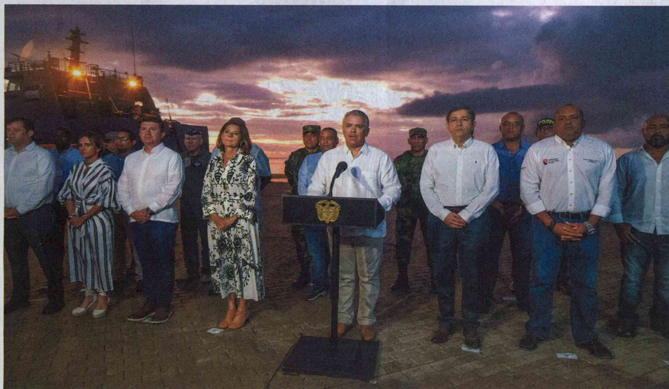
El presidente Iván Duque dijo ayer que Colombia ha tenido una perspectiva de Estado en este pleito, pero expertos aseguran que las administraciones han actuado con visión de Gobierno.

La Corte de La Haya determinó que Colombia violó derechos soberanos de Nicaragua en el mar Caribe; no obstante, la defensa colombiana dijo estar "muy satisfecha" con el resultado del fallo. La decisión llega en plena época electoral, mientras que, en paralelo, avanza un último pleito, con el que Nicaragua aspira a ampliar su plataforma continental. / Tema del día p. 2 a 4