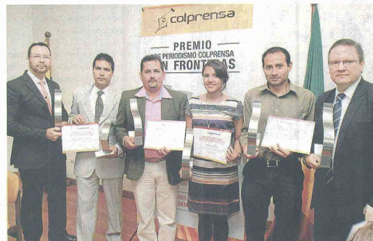
Aquí el grupo de ganadores.

Según el subdirector de Noticias Uno, esta será la oportunidad perfecta "para construir una agenda de paz y generar un espacio de discusión para la reparación de la libertad de expresión", pues ha sido la prensa una de los damnificados de la guerra.