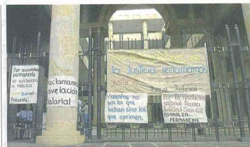
El paro comenzó el pasado 11 de octubre y todavía no se restablece el normal funcionamiento de las dependencias judiciales.

- Mejor cubrimiento informativo: Juan Carlos Monroy de, El Colombiano. - Mejor infografía: Robert Julián Calvo, de la Tarde - Mejor entrevista: Nohora Celedón, de Vanguardia Liberal. - Mejor crónica: Diego Hidalgo de, La Patria. - Mejor reportaje: Germán Jiménez de, El Colombiano. - Mejor fotografía: Luis Estévez de, La Opinión.