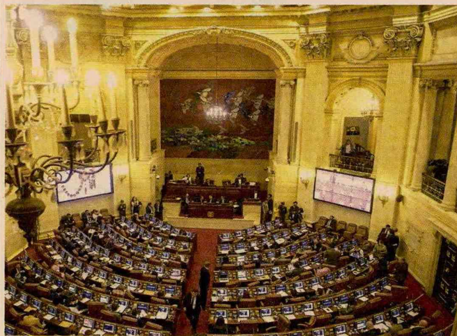
La nueva legislatura irá hasta el 16 de diciembre de este año.

Sobre ese monto de recaudo cercano a $50 billones de los que hablaba Petro en su campaña, ha dicho que sería para los cuatro años de gobierno. Tam-