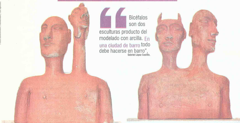
BICÉFALOS, OBRA DE GABRIEL CASTILLO LÓPEZ se quedó con el primer lugar del Segundo Salón de Artes del Fuego.

“Bicéfalos son dos esculturas producto del modelado con arcilla. En una ciudad de barro todo debe hacerse en barro”, Gabriel López Castillo.