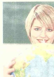
Son 57 universidades las que cuentan con la ‘triple corona’.

La Facultad de Administración de la Universidad de los Andes cuenta con la acreditación otorgada por AASBC, la acreditación internacional EQUIS, otorgada por la European Quality Improvement System y la acreditación AMBA, (Master in Business Administration), emitida por la Association of MBAs. Con estos tres reconocimientos, logró la llamada ‘triple corona’.