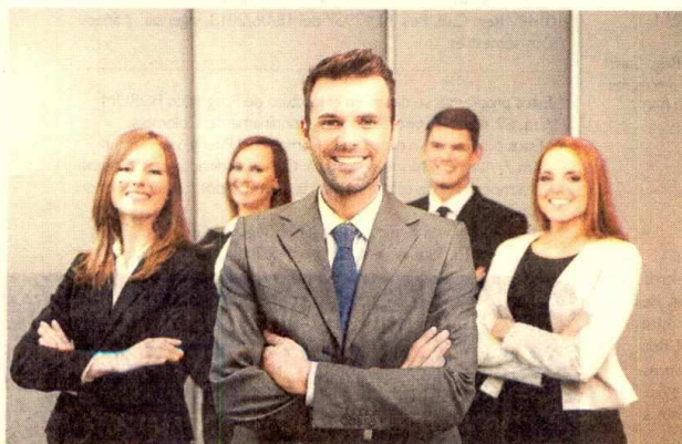
La toma de decisiones con base en el área financiera es la clave en la evaluación de proyectos y finanzas corporativas.

"Son programas que les permiten a las personas formarse, ampliar sus competencias y fortalecer sus habilidades en la toma de decisiones y eso buscan las personas, gerentes y ejecutivos que tienen personas a cargo y que toman decisiones, estar documentados para tomarlas de la mejor forma. La especialización en Gerencia, que es la más amplia e integral, busca formar gerentes y líderes estratégicos que tomen decisiones importantes para sus compañías en estos mercados de economías abiertas y que cumplan con una función de responsabilidad social", agrega Carrillo. ■