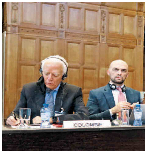
La decisión de la Corte Internacional de Justicia fue leída a las 3 de la