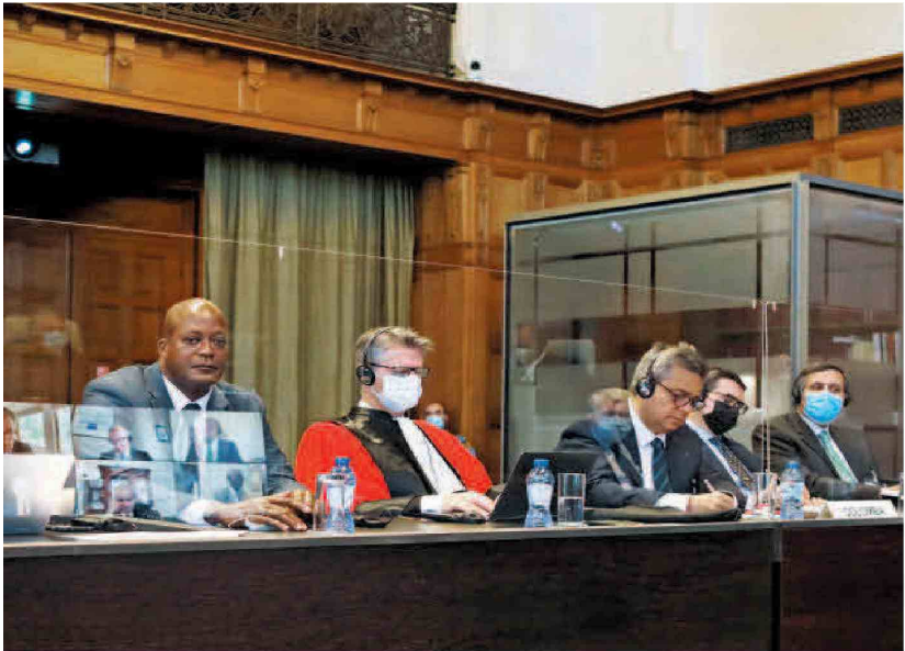
mañana del 21 de abril. Pese a celebración de Colombia, el fallo no es favorable.