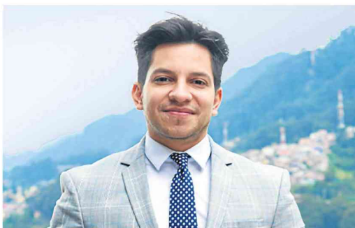
Ministerio de Salud