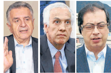
Luis Eduardo Garzón (PDA), Samuel Moreno (PDA) y Gustavo Petro (Progresistas) han encarnado a la izquierda desde la alcaldía.

Así, a los polistas y progresistas solo les quedó de estas elecciones el temor de desandar lo caminado en materia social. "Hay unos programas sociales encomiables, pero no hubo otros para satisfacer otras cosas que exigían los bogotanos".