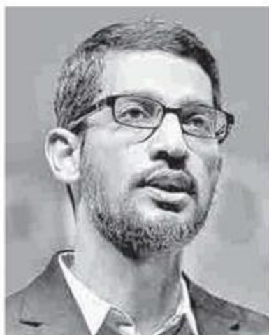
Sundar Pichai, director ejecutivo de Google.