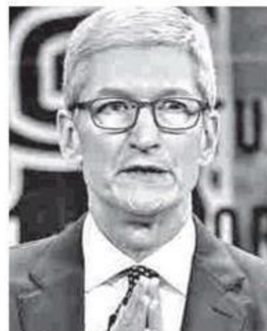
Tim Cook, consejero delegado de Apple.