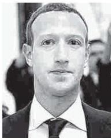
Mark Zuckerberg, fundador y CEO de Facebook.