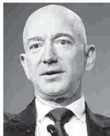
Jeff Bezos, fundador y CEO de Amazon.