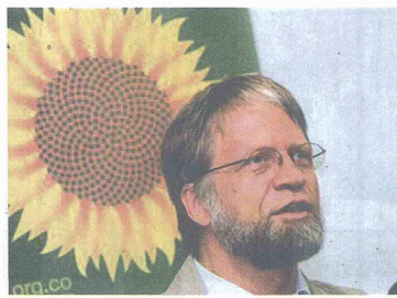
Así mismo le envió un mensaje a los ex alcaldes Lucho Garzón, Enrique Peñalosa y Antanas Mockus para que regresen formalmente a la colectividad y acompañen al partido en la batalla electoral que se avecina.