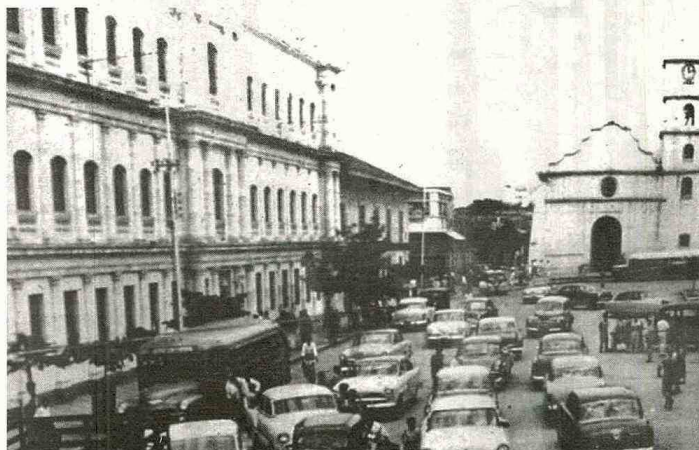
Neiva en los años de 1950