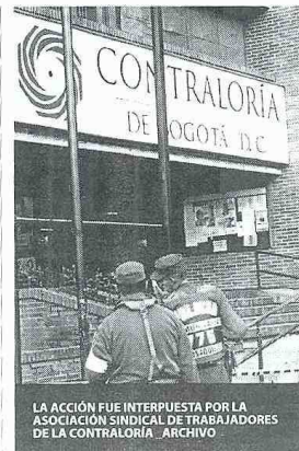
LA ACCIÓN FUE INTERPUESTA POR LA ASOCIACIÓN SINDICAL DE TRABAJADORES DE LA CONTRALORIA.

Tobón integran la terna presentada por la Sala Plena de la Corte Suprema de Justicia, de la cual el Consejo de Estado elegirá el reemplazo del saliente auditor General de la República, Jaime Ardila Barrera. Ardila buscaba reelegirse pero la Corte Constitucional tumbó esta posibilidad.