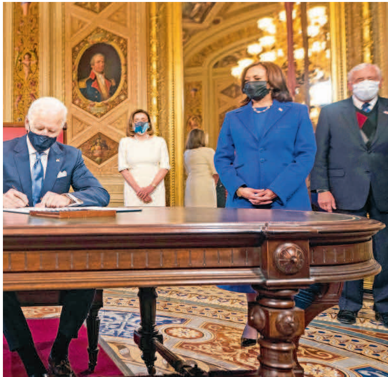
decretos para revertir varias de las políticas cuestionadas a Donald Trump.

pía, pero será un proceso. Sanar las heridas de cuatro años de Trump tomará tiempo y debe haber consistencia entre todos los miembros de esta, asegura Castrillón.