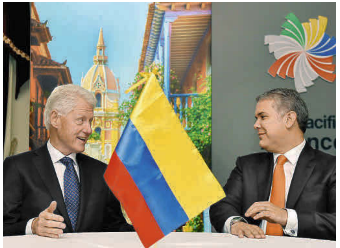
El presidente de Colombia fue el único mandatario latinoamericano que participó en un panel del Foro de Negocios Bloomberg, moderado por el expresidente Bill Clinton .

No obstante, agregó, aunque el gobierno anterior logró un cambio positivo en la per-