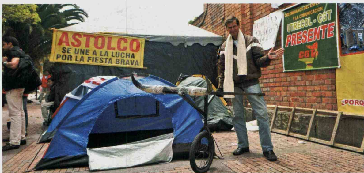
Los taurinos esperan volver a ver toros en la plaza de Santamaría en la temporada de 2017, después de que terminen sus obras de reforzamiento.